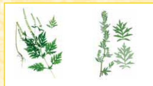
L'ambrosie à feuilles d'armoise :

Le nom de l'espèce ( Ambrosia artemisiifolia ) nous informe sur l'apparence de la plante et sur le fait de la confondre avec une autre plante. « Artemisiifolia » signifie « feuilles en forme d'armoise ». En effet l'ambrosie à feuilles d'armoise et l'armoise commune ( Artemisia vulgaris ) se ressemblent. Toutes les deux appartiennent à la famille des astéracées, toutes les deux peuvent atteindre une hauteur d'un mètre, toutes les deux ont des feuilles pennatilobées divisées.